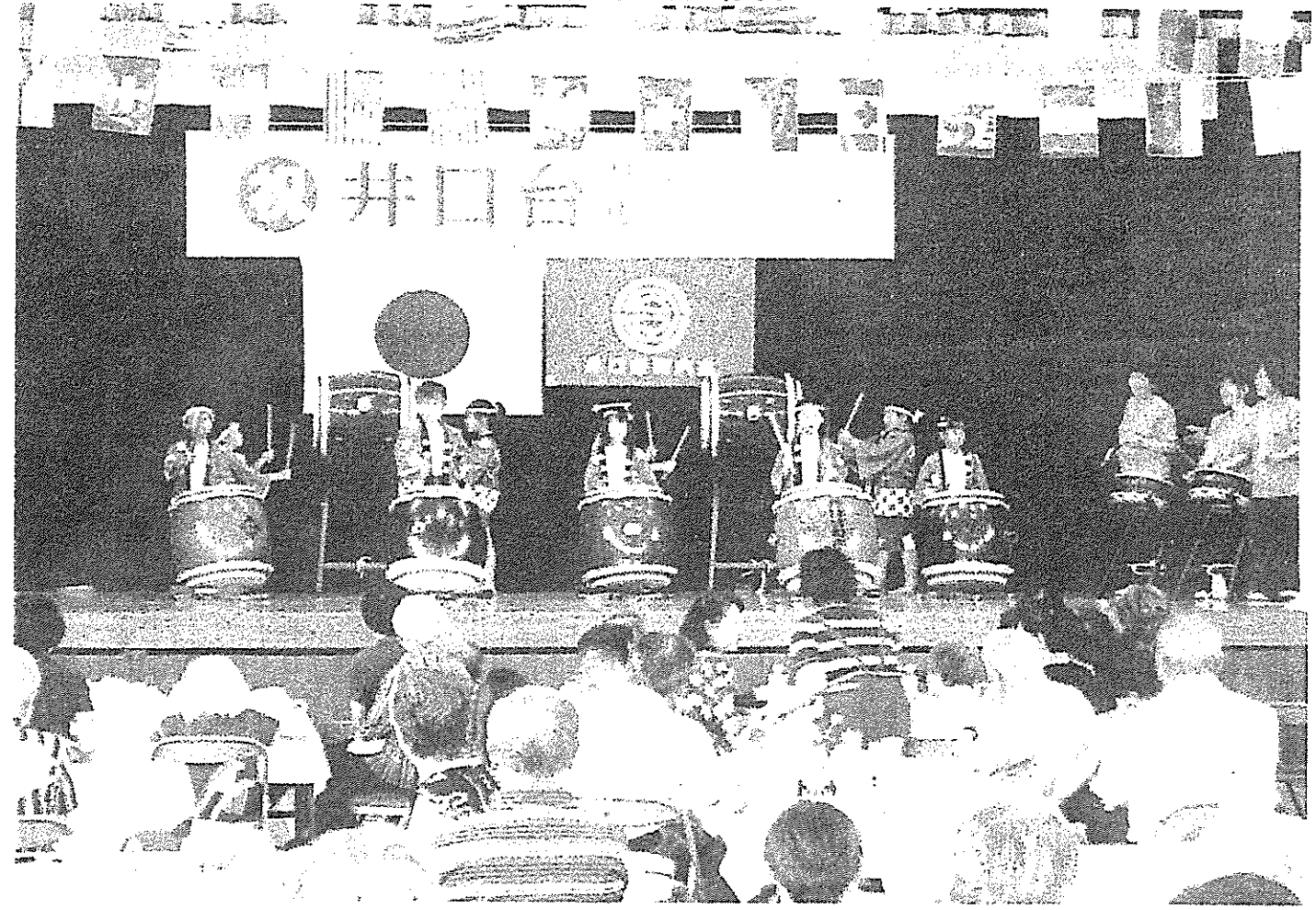
(昨年の敬老会の様子)

ーナー、飲食コーナー、お茶席コーナー、余興コーナーを用意して皆さんに楽しんでいただきます。ささやかな手作りの会ですが、ご歓談、演芸の披露など、ごゆっくりお楽しみいただきたいと思います。